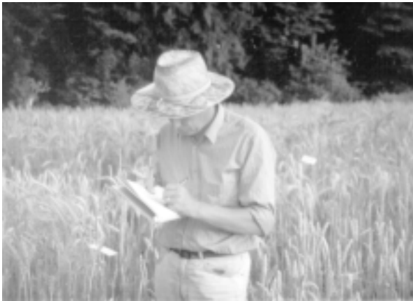
Der biologisch-dynamische Forschungsansatz bezieht den Menschen mit ein

klar formuliert dies Prof. Mengel in der Einleitung zu seinem mittlerweile in der 7. Auflage erschienenen (und von den Sachinformationen selbstverständlich empfehlenswerten) Standardwerk „Ernährung und Stoffwechsel der Pflanze“ (Mengel 1991). Er meint dort, es werde „immer deutlicher, dass auch die Vorgänge in der belebten Natur letzten Endes auf chemischen Prozessen basieren... Die Vorgänge, die sich im Mikrobereich der Moleküle, Atome und Elektronen abspielen, sind also letzten Endes auch für die mannigfaltigen Erscheinungen des Lebens verantwortlich.“ Aus dieser materialistischen „Philosophie“, die den Stoff als die Grundlage der Lebenserscheinungen ansieht, ist es verständlich, dass die sogenannte moderne Naturwissenschaft in dem genetischen Code die Grundlage allen Lebens sieht und enorme Anstrengungen (und natürlich auch staatliche Fördermittel) in die Erforschung und Nutzung der Gentechnik fließen.